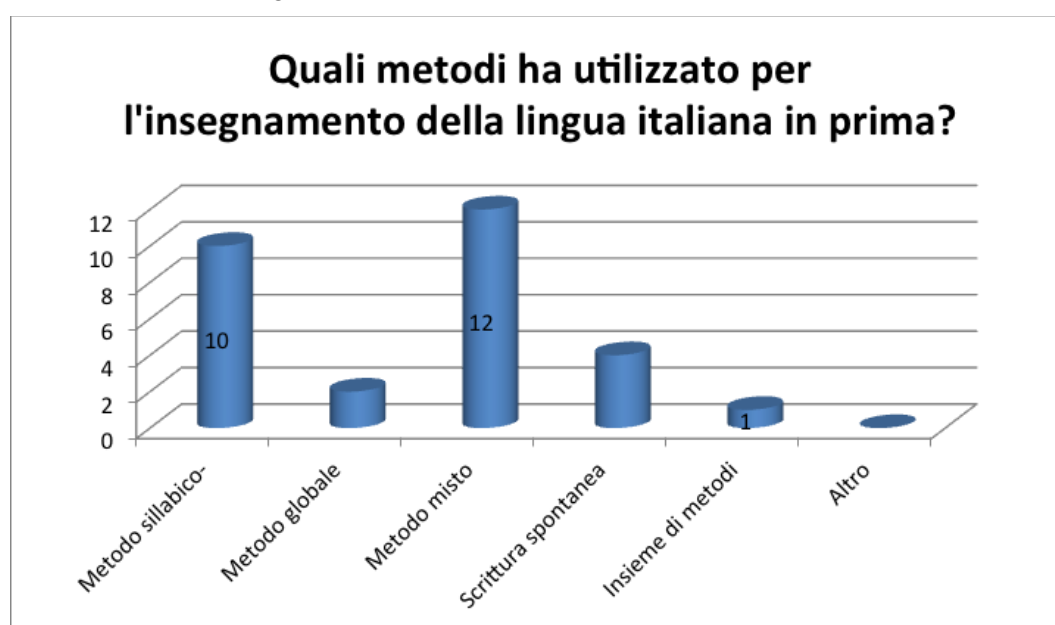
Figura 2. Risposte sui metodi per insegnare a leggere e scrivere.

Come già osservato nel paragrafo precedente il metodo Pizzigoni non pone o impone dei riferimenti obbligatori, dei metodi particolari da seguire in modo determinato, ma suggerisce degli approcci, stimolando costantemente la curiosità, la motivazione, l'interesse a leggere e scrivere. Così sottolinea Pizzigoni anche nel confronto con l'alfabeto: "L'insegnamento della lingua comprende anche l'apprendimento dell'alfabeto. Per ciò il metodo dell'esperienza vuole che il ragazzo senta la necessità della lettura e si faccia poi abile nell'uso delle lettere. Per quest'ultimo esercizio servono i caratteri mobili e i sillabari che rendono possibili numerose esercitazioni; per la prima ragione il ragazzo proverà il desiderio della lettura quando ne avrà intuita la necessità. E un buonissimo stimolo a ciò sono le etichette col nome volgare delle varie piante del giardino, che il bambino desidera conoscere, e le poche parole di spiegazione scritte sotto le vignette dei libri illustrati, che la libreria della scuola ha raccolto anche per i bimbi analfabeti. Conosciuta l'utilità pratica della lettura, il bambino troverà interesse anche nell'apprendere l'alfabeto" (Pizzigoni, 1922/1956, pp. 68-69). Proprio in questa prospettiva di apertura, ma anche di indagine è stato posto il seguente quesito agli attuali docenti della scuola relativo ai metodi utilizzati (Figura 2).