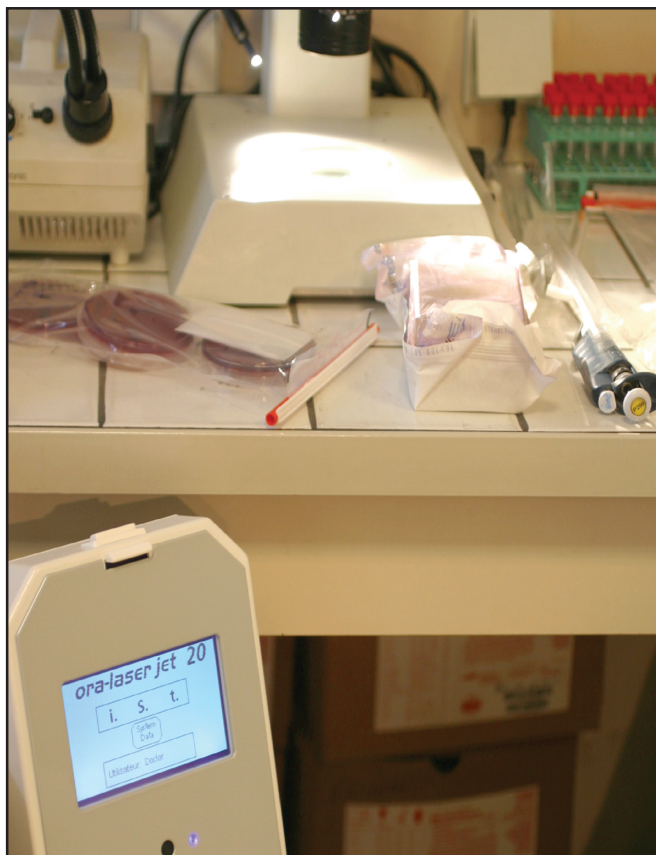
Fig.1: Láser de diodo Oralial 810 \mu\text{m} .