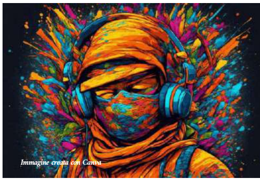
Immagine creata con Canva