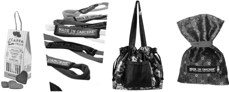
Figura 4 – I prodotti “Made in Carcere”

ne Università come la Bocconi, Cattolica del Sacro Cuore di Milano e LUISS (Libera Università degli Studi Sociali Guido Carli di Roma), Trenitalia, Trenord e anche all'estero (Delle Donne, 2024).