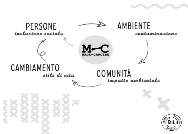
Figura 6: Core business di “Made in Carcere” (Fonte: Delle Donne, 2024)

Nello specifico, gli ambiti di intervento del progetto sono: I) il reinserimento lavorativo, tramite la diffusione del modello “Made in Carcere” e le buone pratiche sviluppate nell’ultimo decennio, impiegando in modo stabile i detenuti nei settori del tessile e dell’ agri-food ; II) creazione di una “Social Academy” per offrire ad associazioni e cooperative dei corsi di formazione su diverse tematiche, con l’obiettivo di studiare e applicare questo modello ai propri contesti, che tratteranno varie tematiche, tra cui la sostenibilità sociale, ambientale ed economica, andando ad approfondire argomenti quali lo smaltimento dei rifiuti, la gestione del personale e l’amministrazione (Delle Donne, 2024) (Figura 6).