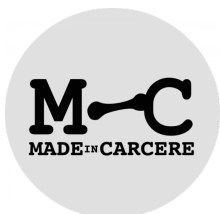
Figura 3: Marchio di “Made in Carcere” (Fonte: Delle Donne, 2024)

la possibilità di affrontare un percorso formativo finalizzato al reinserimento nel mondo del lavoro e nella società civile.