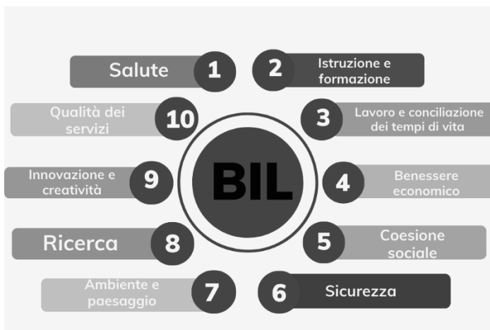
Figura 2: Le dimensioni del benessere nel BIL

Nel passaggio dal BES al BIL, si osservano tre cambiamenti rilevanti: