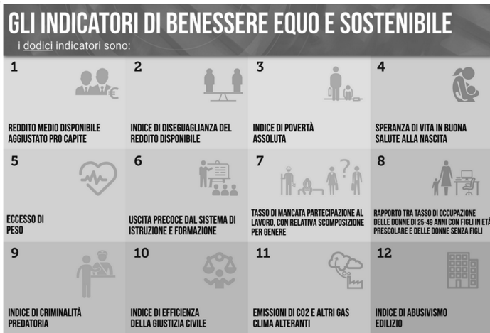
Figura 1: Benessere Equo Solidale

In Italia, un contributo considerevole nel superamento del PIL è stato fornito dal Benessere Equo e Sostenibile (BES), indice elaborato per la prima volta nel 2010 grazie alla proposta congiunta del CNEL (Consiglio Nazionale dell’Economia e del Lavoro) e dell’ISTAT (Istituto Nazionale di Statistica), che offre un approccio innovativo di misurazione della qualità della vita dei cittadini italiani, oltrepassando gli aspetti economici e materiali, attraverso dodici domini articolati in una serie di indicatori (ISTAT, 2025). Nello specifico, per “benessere” si fa riferimento alla qualità della vita dei cittadini; per “equità” alla distribuzione equa dei fattori che influenzano il benessere tra diversi gruppi sociali; e per “sostenibilità” la sicurezza del mantenimento del benessere per le generazioni future. Il decreto del Ministero dell’Economia e della Finanza (MEF) del 16 ottobre 2017 ha individuato gli indicatori come riportato nella figura che segue.