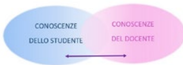
Figura 2: Fase di apprendimento dell'insegnamento orizzontale

Per poter entrare nell'intersezione è necessario conoscere i propri studenti, conoscere le loro vite, i loro interessi, esplorare i loro stili di apprendimento. E quindi adottare trasposizioni didattiche adeguate a quelle vite, quegli interessi, quegli stili di apprendimento. Espandere l'intersezione, poi, non significa solo dare nuove nozioni ma significa innanzitutto condurre lo studente all'espansione del proprio modo di apprendere, mettendo lo studente nelle condizioni di "imparare ad imparare". Notiamo che quando l'intersezione si espande non è escluso che si espanda anche nell'altro senso, dallo studente al docente che impara qualcosa dagli studenti (vedi la doppia freccia orizzontale in figura 2). È, anzi, questa la caratteristica più importante dell'insegnamento orizzontale, poiché apprendono entrambe le parti (docente e studenti): un processo di insegnamento/apprendimento. Forse il docente che entra in carcere può inizialmente fare fatica ad immaginare cosa possa contenere l'intersezione con i suoi studenti, ma certamente cercando di "leggere sul viso degli studenti, [...] di capire le loro aspettative, le loro difficoltà", mettendosi al loro posto, come suggerisce Pólya (ibid.), il docente comprende che occorre partire da ciò che certamente abbiamo in comune: l'umanità.