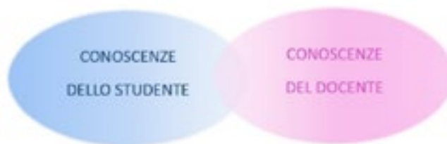
Figura 1: Fase preliminare dell’insegnamento orizzontale

Nettamente contrapposta a una pratica didattica (purtroppo ancora largamente diffusa) che potremmo definire “verticale”, la teoria dell’Insegnamento Orizzontale (Ferrarello, Mammana & Pennisi, 2013) è un modello di insegnamento/apprendimento, in cui l’insegnante non è posto in alto pronto a travasare verso il basso le sue conoscenze. Nell’insegnamento orizzontale, i due insiemi delle conoscenze dello studente e del docente sono posti allo stesso livello e hanno una intersezione (Fig. 1).