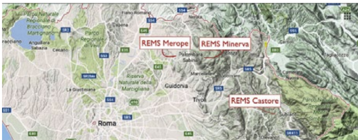
Sedi REMS sul territorio della ASL RM 5

Ci sono stati contatti preliminari tra i responsabili della ASL e del CPIA, ai quali ha partecipato anche il Garante delle persone sottoposte a misure restrittive della libertà personale del Lazio. Hanno fatto seguito alcune riunioni operative nel corso delle quali sono stati messi a punto l'organizzazione delle attività didattiche e sono stati stabiliti tempi e modi per la realizzazione della sperimentazione.